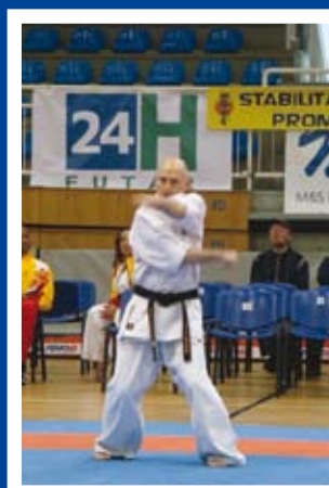
Prosportowo na osiedlu str. 10