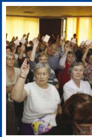
Publiczna i partnerska dyskusja członków i władz spółdzielni str. 3