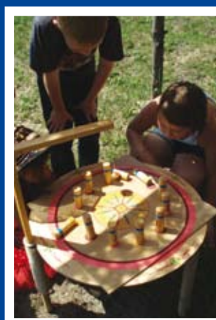
Smutna mina? Tylko wtedy, gdy trzeba wracać do domu... str. 8