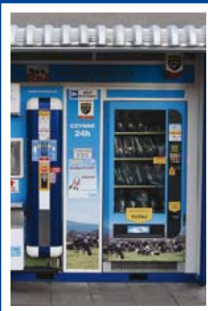
Blisko zdrowo i bardzo niezwykle str. 3