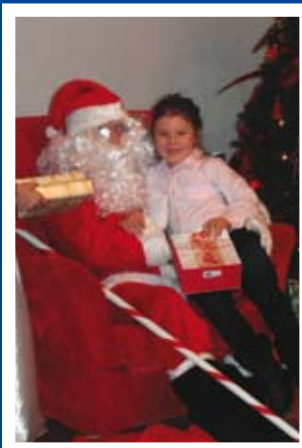
W tym roku również zawitał str. 4