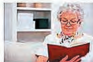
UNIwersytet TRZECIEGO WIEKU