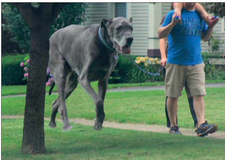
Pies największym przyjacielem człowieka