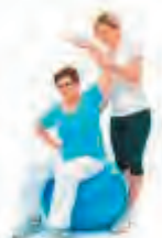
GABINET REHABILITACJI I FIZJOTERAPII