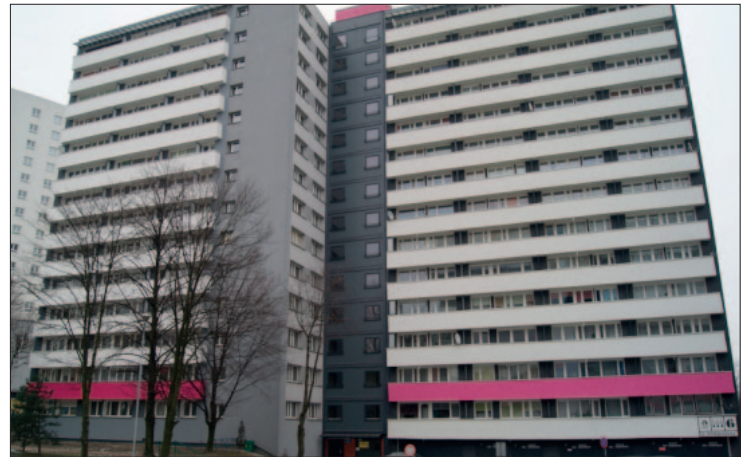
Elewacja budynku Tysiąclecia 6 po wykonanym remoncie

Piastów 9, 10, 26 – w segmentach piwnicznym i garażowym,