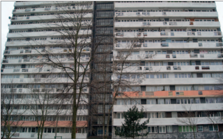
Elewacja budynku Chrobrego 43 przeznaczona do remontu