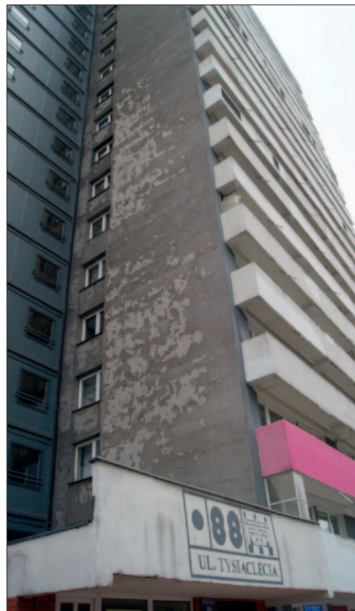
Ściana szczytowa budynku Tysiąclecia 88 przeznaczona do termomodernizacji,