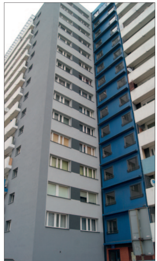
Ściana szczytowa budynku Piastów 18 po wykonanej termomodernizacji w 2017 roku