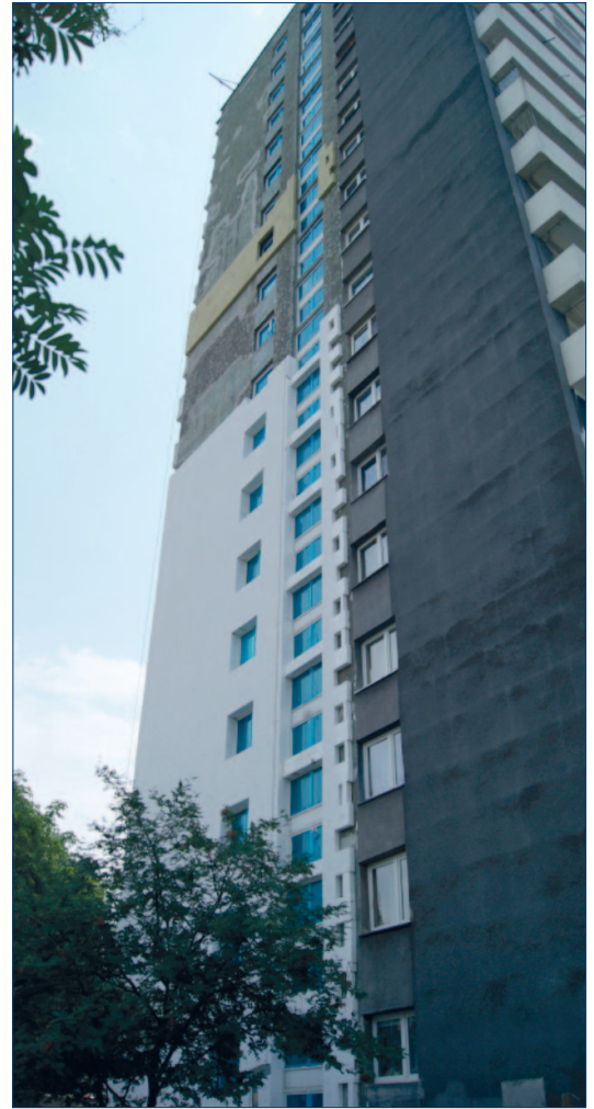
Elewacja budynku przy ulicy Tysiąclecia 88