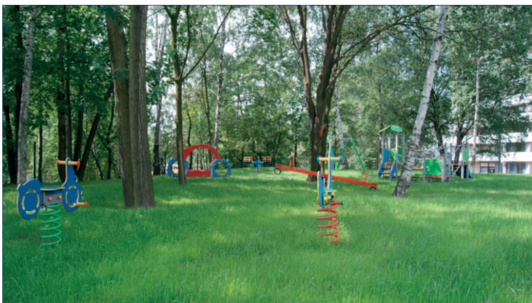
Plac zabaw przy skwerze w rejonie ul. Zawiszy Czarnego 2-9