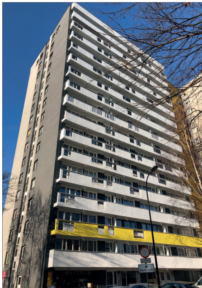
Ch32 – zakończony remont elewacji - segment garażowy str. wschodnia.