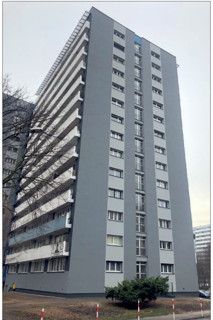
P10 – zakończona termomodernizacja ściany szczytowej z zadaszeniem ostatniej kondygnacji.