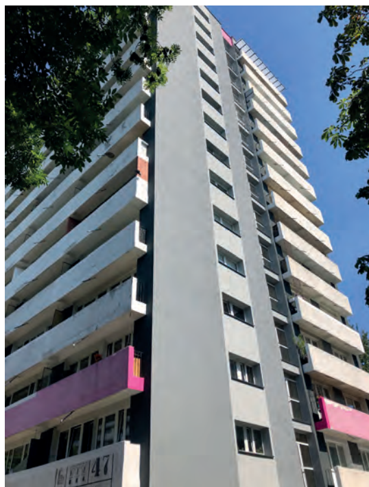
Ul. Tysiąclecia 47 - zakończona termomodernizacja ścian szczytowych segmentu garażowego

- miejscowe naprawy nawierzchni chodników i dróg dojazdowych przy budynku Zawiszy Czarnego 9,