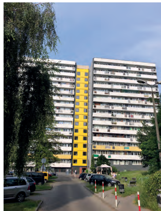
Ul. Chrobrego 38 zakończona przebudowa ścian osłonowych ciągu komunikacyjnego

- ułożenie kostki w wygradzeniu na śmieci, miejscowa naprawa nawierzchni drogowej przy budynku Tysiąclecia 19.