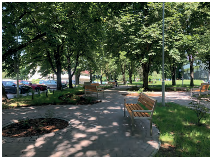
Ul. Tysiąclecia 47 - zakończona budowa skweru i parkingu

Spółdzielnia dokłada wszelkich starań, aby realizowane roboty były wykonywane terminowo i możliwie bezpiecznie. Ponadto, w celu zapewnienia bezpieczeństwa mieszkańcom, dezynfekowane są codziennie newralgiczne miejsca w budynkach oraz urządzenia zabawowe na otwartych placach zabaw – do dyspozycji mieszkańców pozostają trzy największe place zabaw: na Dolnym przy ul. Piastów, na Górnym w rejonie ul. Ułańskiej oraz w środkowej części osiedla przy siedzibie Spółdzielni, a także drewniany plac zabaw przy ul. Tysiąclecia 19.