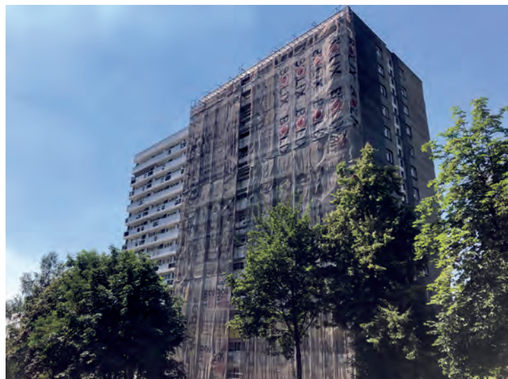
Ul. Chrobrego 32 - remont elewacji

- remont dachu wraz z korytem deszczowym i remontem kominów w segmencie piwnicznym budynku przy ul. Tysiąclecia 6,