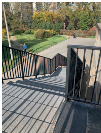
Zawiszy Czarnego 10 - remont schodów zewnętrznych