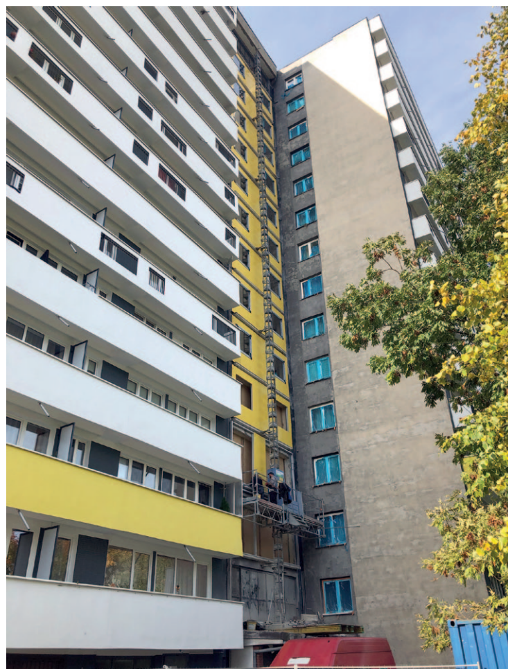
Chrobrego 43 - przebudowa ścian ciągu

Do najważniejszych zakończonych na ten rok prac należą: inwestycja, o której pisaliśmy szerzej w poprzednim numerze – montaż instalacji fotowoltaicznych na dachach budynków Chrobrego 9, Chrobrego 38, Tysiąclecia 47 i Piastów 24, remont korytarzy lokatorskich w budynkach Piastów 3 i Ułańska 9, wymiana