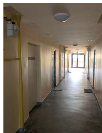
Piastów 3 - remont korytarzy lokatorskich