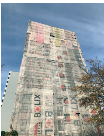
Chrobrego 37 - termomodernizacja ściany szczytowej