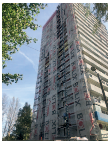
Piastów 9 - termomodernizacja ściany szczytowej