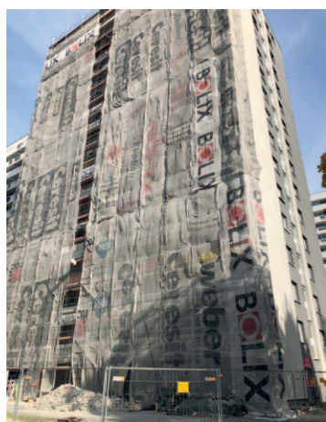
Chrobrego 32 - remont elewacji